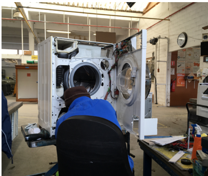
Foto: Bezoek bij Kringwinkel Z-O- Vlaanderen in Geraardsbergen

Kringwinkels spenderen heel wat tijd aan het herstellen van elektr(on)ische toestellen om ze nadien aan te bieden in de verkoopsafdeling. De potentiële omzet van herbruikbaar elektro is groot, mits dit de nodige aandacht krijgt en duidelijke prioriteiten voorop worden gesteld. We gingen daarom in gesprek over de impact van tijd als toegevoegde waarde .