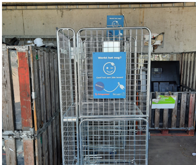
Foto: Kar 'Bewarend Inzamelen' op het recyclagepark van Kortrijk

Het project Bewarend Inzamelen breidt uit naar de recyclageparken van Boortmeerbeek, Begijnendijk, Kortrijk en Brugge.